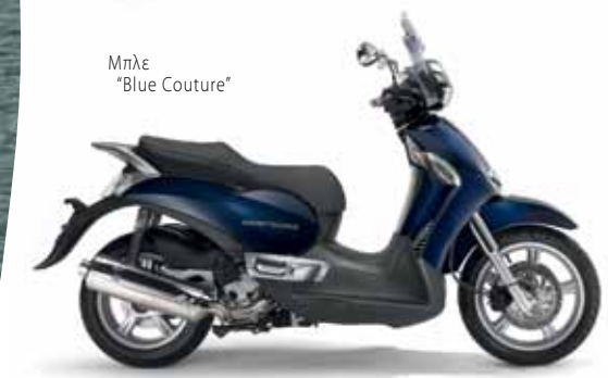
Μπλε "Blue Couture"