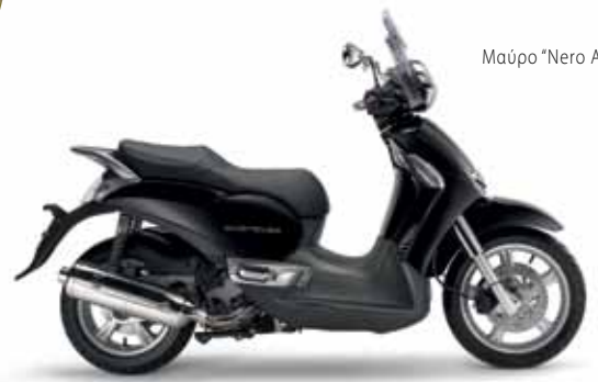
Μαύρο "Nero Aprilia"