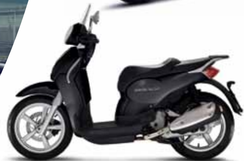
Μαύρο "Nero Aprilia"