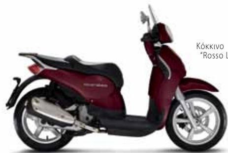
Κόκκινο "Rosso Luxury"