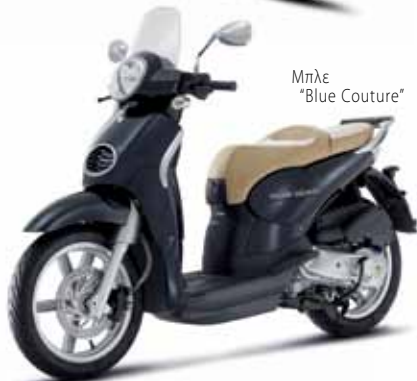
Μπλε "Blue Couture"