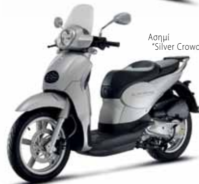
Ασημί "Silver Crowd"