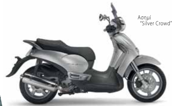
Ασημί "Silver Crowd"