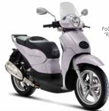
Ροζ "Rosa Silk"