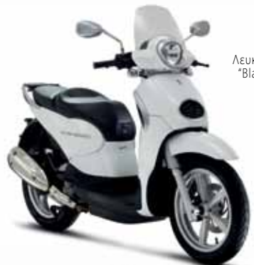
Λευκό "Blanco Flair"